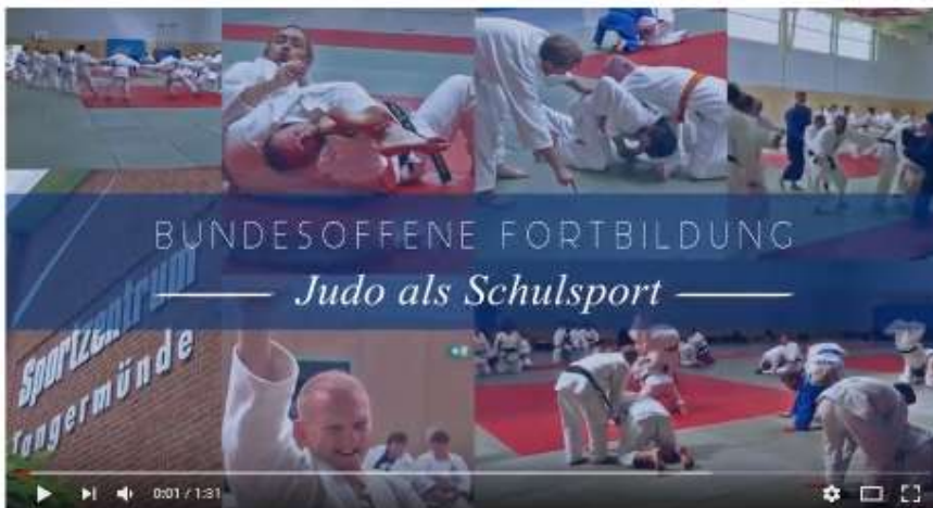
Judo Bundesoffene Trainer- und Lehrerfortbildung ( Judo Clinic)

https://www.youtube.com/watch?v=pFFdagrmQcs